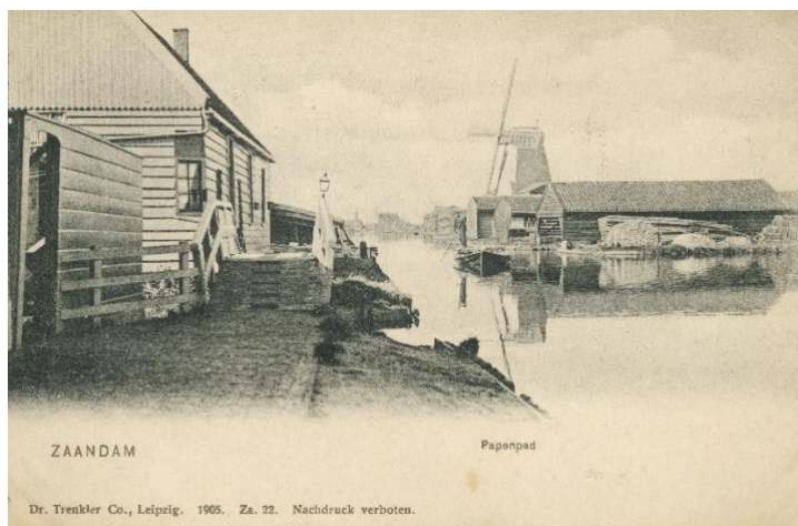
Papenpad met molen De Smid