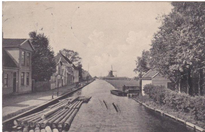
Begin van het Papenpad ca. 1900

Het is nu moeilijk voor te stellen dat de Papenpadsloot vroeger een belangrijke vaarweg was tussen de Zaan en het Westzijderveld. Via de sluis kon het aangevoerde hout, meestal balken, uit het buitenland zijn weg vinden naar de houtzagerijen. In het Westzijderveld achter de Westzijde waren namelijk tal van houtmolens en houthandels gevestigd. Bedrijven als Van Wessems, Gebr. Endt, Simonsz, Schipper en Dekker zorgden voor een druk scheepvaartverkeer. Het gezaagde hout werd op dekschuiten weer afgevoerd naar de Zaan. Rond 1900 werden jaarlijks tienduizenden balken aangevoerd met de zeeschepen. De balken werden vervolgens in vloten samengebundeld. Overal in de Zaanstreek lagen balkenvloten te wachten op verwerking. Niet alleen in de Voorzaan, maar ook in de Achterzaan bij de Hemmes en de Poel, en bij de houtmolens zelf lagen grote hoeveelheden balken in het water.